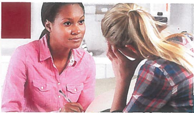
Our dedicated staff is ready to listen and help in any way they can.